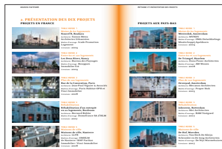
extrait du livre