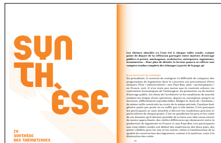
extrait du livre