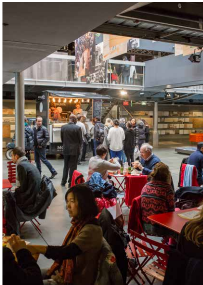
Brunchs autour des expositions