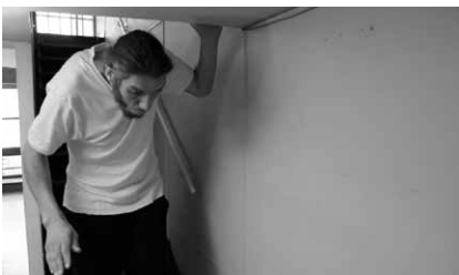
Projections de films