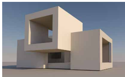
Installation d'un prototype d'habitat modulaire autonome