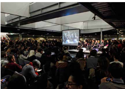
Débats Grand Paris