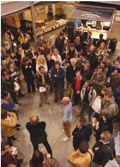
Nocturnes : visites guidées & foodtruck