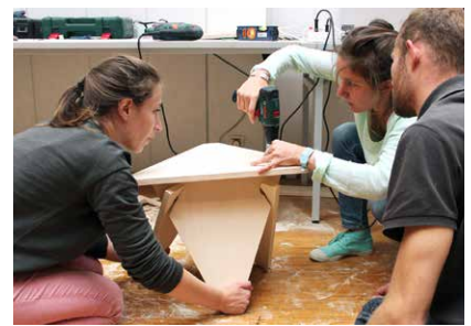
Ateliers Chutes libres