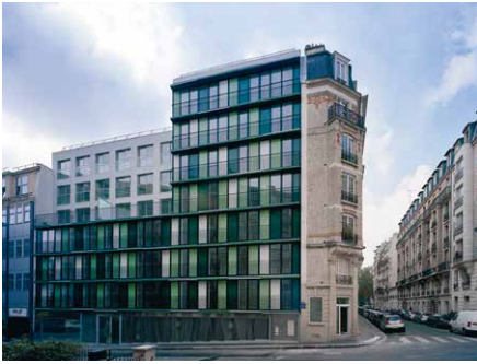
2008, 63 logements, 75012 Emmanuel Combarel, Dominique Marrec architectes