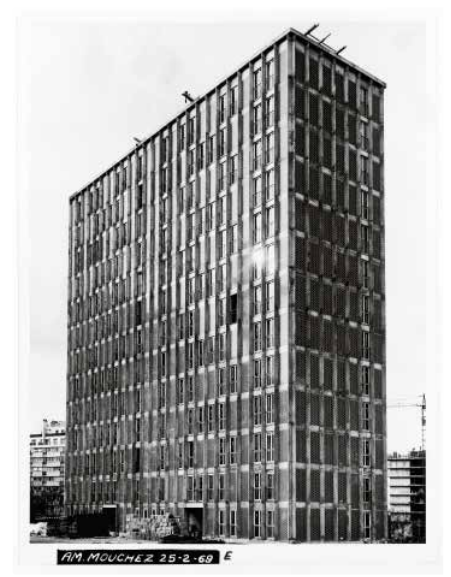
1965, 414 logements, 75013 Adrien Brelet, André Le Donné, Marcel Bataille et Zdzislaw Bujajski architectes