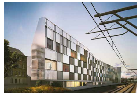
2018, 251 logements, 75015 Tank Architectes © Tank Architectes