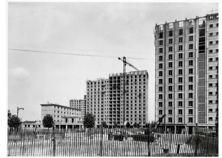
1961, 592 logements, 92240 Denis Honegger