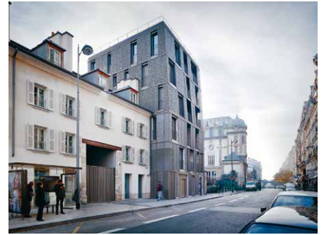
2013, 234 logements, 75015 Thibaud Babled Architectes Urbanistes