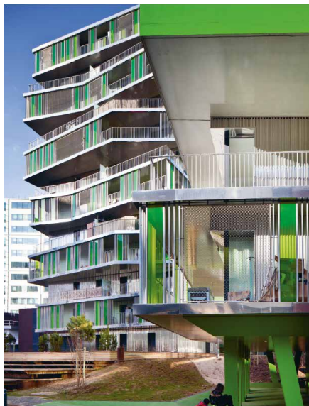
2011, 62 logements, 75012 Hamonic + Masson, architectes