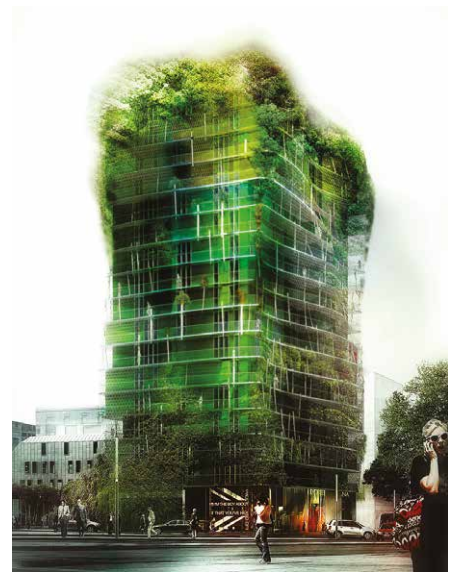
2015, Tour de la Biodiversité, 75013 Maison Édouard François / Base Paysagiste © Maison Édouard François