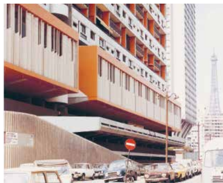
1973, 180 logements, 75015 Jean-Claude Jallat / Michel Proux, architectes