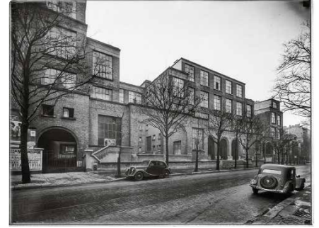
1930, 165 logements, 75018 Adolphe Thiers, architecte © Archives Paris-Habitat-OPH