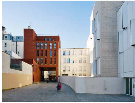
2008, 8 logements, 75018 Olivier Boiron / Philippe Freiman, architectes © © Antoine Mercusot