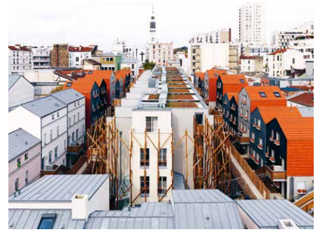
2009, 99 logements, 75020 Maison Édouard François, architecte © David Boureau