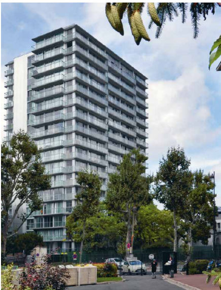
2011, Tour Bois le Prêtre, 100 logements, 75017 Frédéric Druot / Lacaton & Vassal, architectes