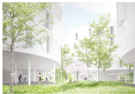
2017, 234 logements, 75015 Kazuyo Sejima + Ryue Nishizawa / SANAA - Tokyo Antoine Saubot + Michel Lévi / Extra Muros - Paris © Kazuyo Sejima + Ryue Nishizawa / SANAA