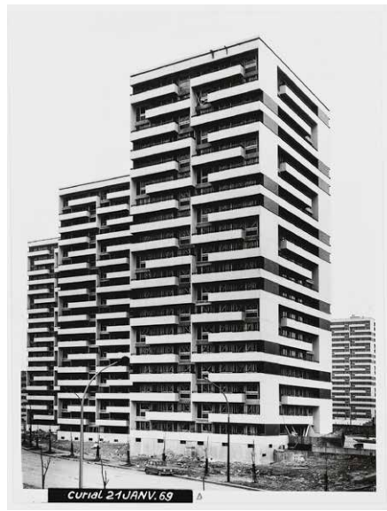
1969, 1767 logements, 75019 André N. Coquet / Henri Auffret / D. Auger, architecte