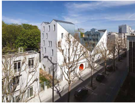
2012, Logements, 75017 Stéphane Maupin, architecte