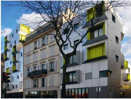
2010, 63 logements, 75018 X-TU Architectes