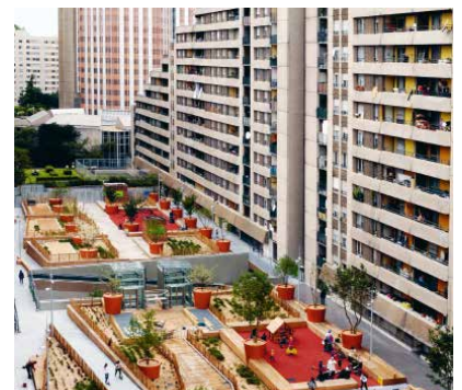
1976, 298 logements, 92100 Daniel Badani / Pierre Roux-Dorlut / Pierre Vigneron, architectes