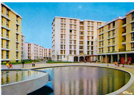
1973, 1 190 logements, 94350 Denis Honegger, architecte