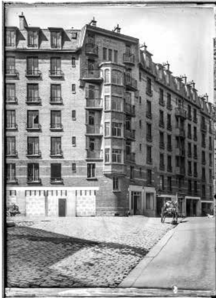
1923, 345 logements, 75019 Office Public d'Habitations à Bon Marché