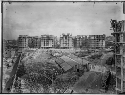
1930, 274 logements, 75018 Office Public d'Habitations à Bon Marché, maître d'oeuvre