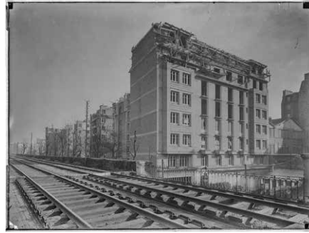
1925, 147 logements, 75012 Office Public d'Habitations à Bon Marché, maître d'oeuvre