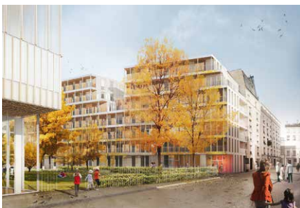
2016, 49 logements, 75011 TBéal & Blanckaert Architectes © Béal & Blanckaert Architectes