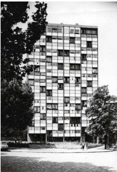
1961, Tour Bois le Prêtre, 100 logements, 75017 Raymond Lopez, architecte