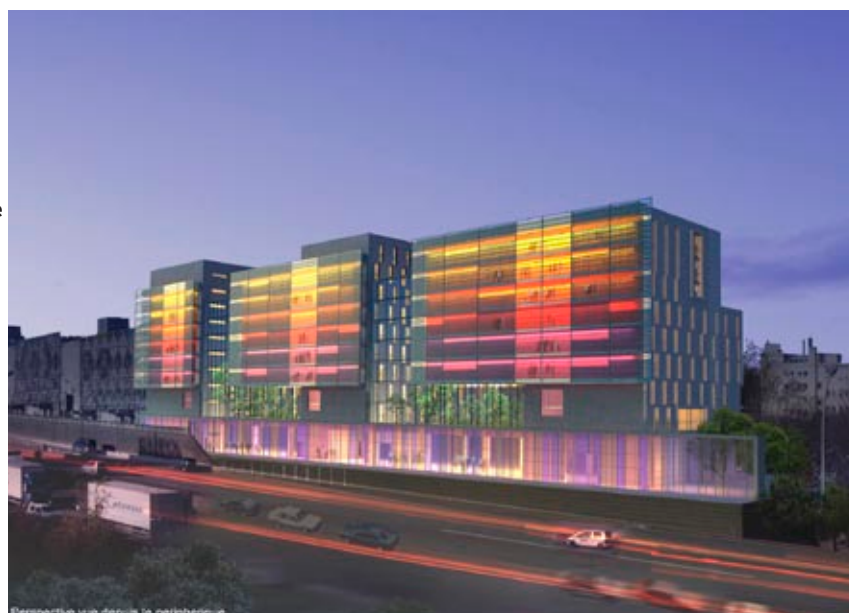
Perspective vue depuis le périphérique