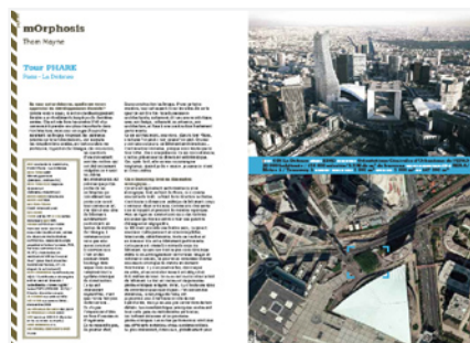
extrait du livre