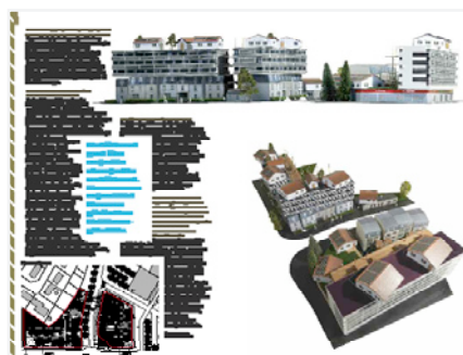
extrait du livre